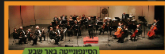
הסינפונייטה באר שבע