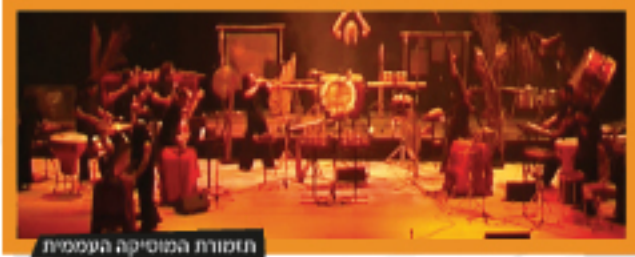
תזמורת המוסיקה העממית

סדנה לכל המשפחה בה מציגים חברי התזמורת את כלי הנגינה המיוחדים שלהם, ומשתפים את הקהל בנגינתם. את האירוע ינחו במשותף אלחנדרו איגלסיאס, מנצחה של התזמורת ומיכאל וולפה.