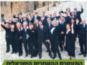
התזמורת הקאמרית הישראלית

חגיגה של מוסיקה קלאסית, מודרנית, זמר עברי ורוק ישראלי.