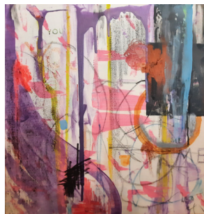
איילת בן נר