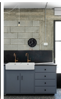
עדי כהן גזונדהייט