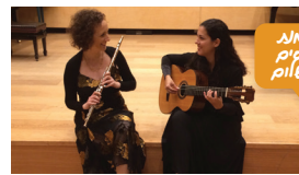
הפסנתר כלאסיים אולם kll

יצירות מקוריות מאת שש מלחינות ישראליות: רוני רשף, אביה קופלמן, חנה אגיאשווילי, דלית רייך, ענבר גולן ואור קדישזון